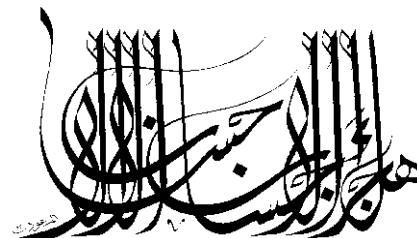
“Não será a bondade a recompensa da bondade?” (Alcorão 55,60). Caligrafia de Hassan Massoudy

A mesquita - não há altares, não há imagens, mas há letras árabes em toda parte. Esses sinais, curiosamente revoltos e cursivos aparecem pintados e esculpidos nas paredes, tecidos nos tapetes e nos medalhões que pendem do teto. A letra árabe é a razão de ser da mesquita. Por ser uma casa da escrita, é a mesquita uma casa de Deus. A mesquita é uma casa de leitura, porque leitura é prece 2 .