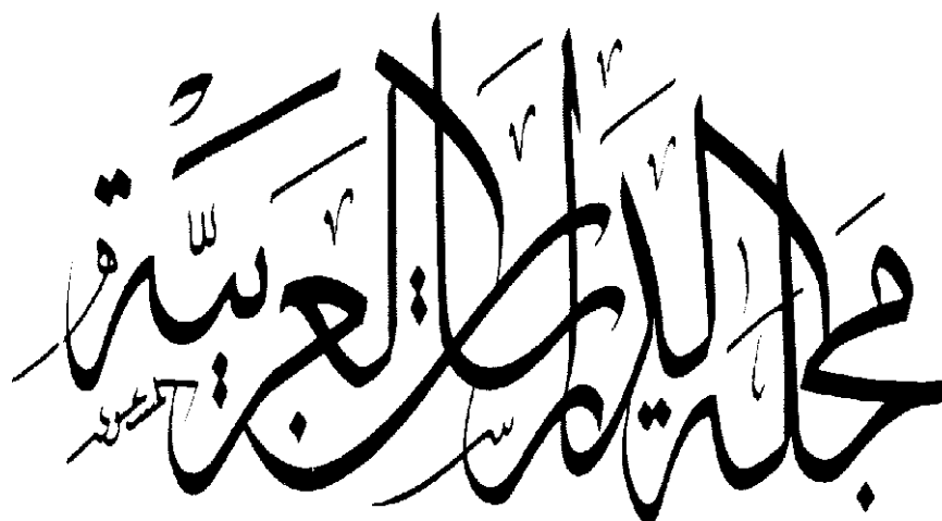
“Revista de Estudos Árabes” - Caligrafia de Hassan Massoudy para a capa da Revista de Estudos Árabes do DLO-FFLCH-USP.

Dada sua estatura religiosa e considerando sua infinita gama de qualidades estético-estilísticas, a Caligrafia não se restringe apenas à mesquita: faz parte do ambiente didático da madrassa 4 ; entra na composição decorativa da cerâmica, da tapeçaria e de mosaicos; alça-se aos cumos de monumentos e palácios; chega às tumbas; adquire, por vezes, no entanto, o caráter documental de uma época, pela celebração de nomes e de feitos de governantes; integra pergaminhos e livros científicos e literários, participando, assim, de instâncias que a fazem penetrar também no domínio do profano.